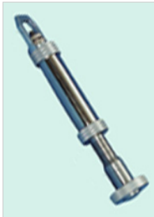
▶ 局方関連機器1 ▶ 錠剤用硬度計 (モンサント型) KI441・442 ▶ 融点測定器 KI343