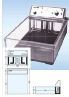
▶ 中型恒温水槽 KG736-20 KG736-25