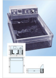
▶ 中型デジタル恒温水槽 KG376-31 KG376-35