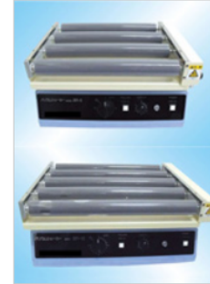
▶ パリウム関連製品 ▶ パリウムシェーカー KL101~102