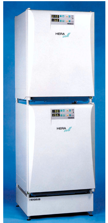
ヘラセル150のダブルチャンバーでの設置例